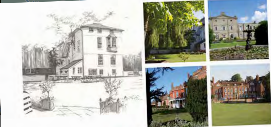
CAE Friends and Alumni Girton (1975-2020), MH (1994-2019), OBH (2012-2019), PHC (2004- 2019)